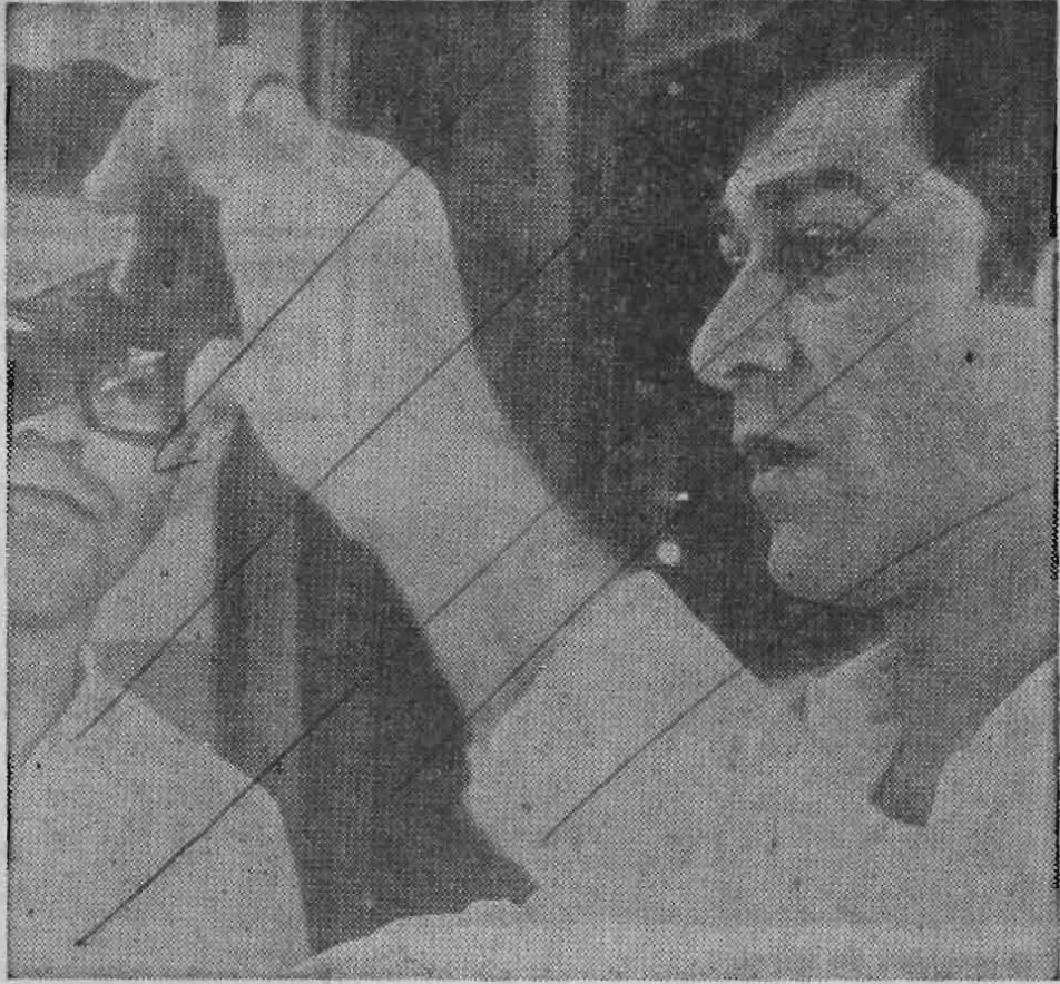
Os negativos das fotos do disco-voador

Segundo consta do depoimento dos policiais, o objeto tinha a forma ovoide, emitia som estridente e um foco de luz amarela.